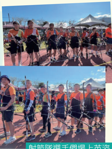
射箭隊選手們場上英姿