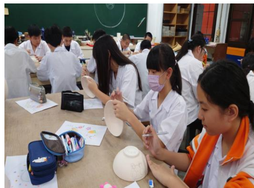
學生課堂繪畫陶碗