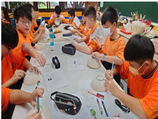
學生課堂繪畫陶碗