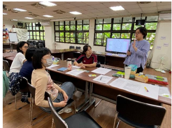
外聘講師說明與示範