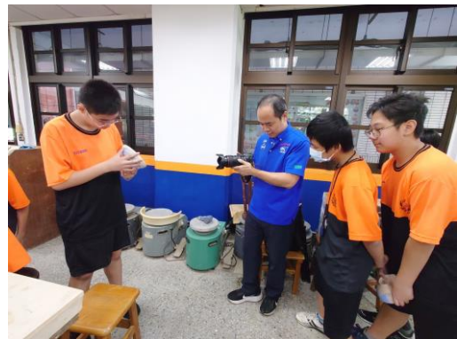
學生分享自己祖孫故事