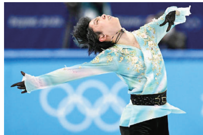
羽生結弦挑戰4周半跳失利，但仍被判定為旋轉角度不足的4A，成為歷史新頁。

所以，他有別於歷來選手抉擇了4A，已經讓其他參賽者懾服；突破自我等同突破人類，更標註出他的能力早已超越一般，所以，即使因為4A而失去金