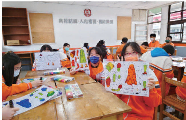
七年級小柑仔皮影戲課堂照片