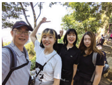
厚成學長和三千金

有一位成功的父親，寫一本書留給他的孩子，內容只講他童年的夢想。他列出幾個自己童年的夢想，第一個夢想是到迪士尼工作，得到那個遊樂園裡最大的布娃娃，後來他真的到迪士尼工作，也得到了一個最大的布娃娃，在別人看來，這是一個很好笑的夢想，但也因為他從小就有夢想清單，而且一一實現，成就了自己的生命，這時他的生命內涵和成就，早已不只是得到迪士尼的布娃娃。