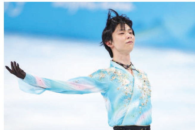
羽生結弦這回在北京冬奧奪得第4名，但仍然改寫歷史。