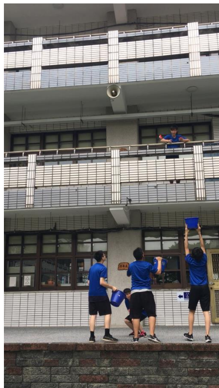
活動執行現場畫面