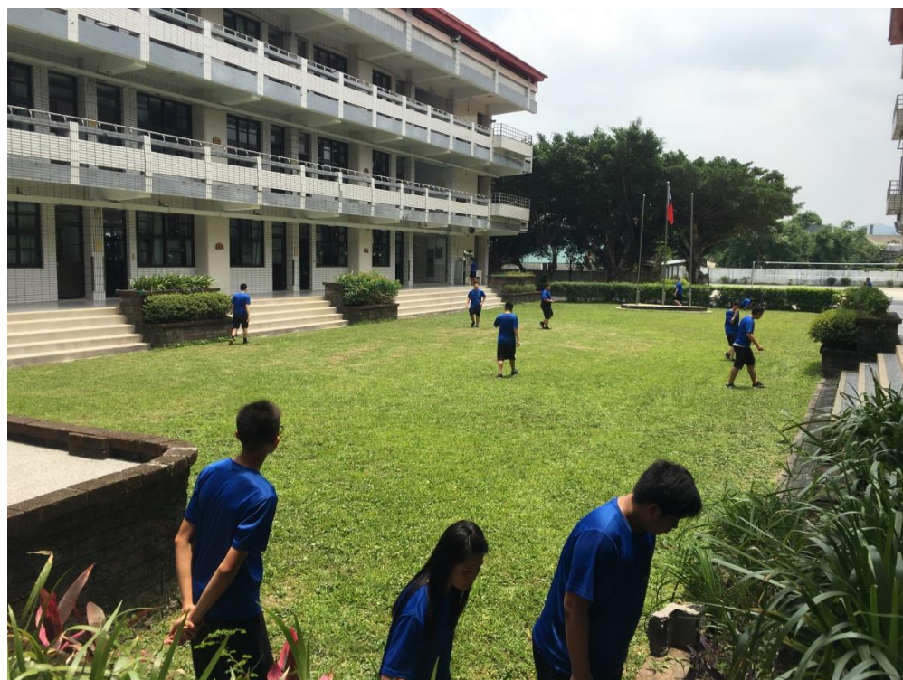
活動執行現場畫面