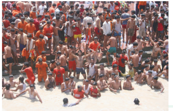
印度教徒赴聖地北阿坎德省哈里德瓦取恆河水

其實，我認為從事任何行業，都要實事求是，這樣會讓你的人生方向更正直，得到更多利益吧！這個利益不是金錢或物質上的利益，而是讓自己的人生更豐富，那一把尺是掌握在自己手裡的。