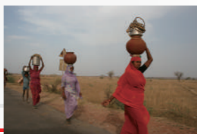
西印拉吉斯坦省婦女取水