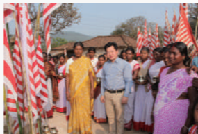
宏儒學長赴東印加爾各答德省毛派游擊隊掌控下的部落採訪婦女活動