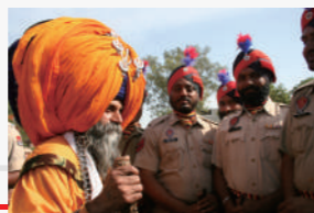
錫克教上師與旁遮普警察

記者的敏感直覺，讓我敏銳、清醒的腦袋立即非常清楚的知道要到哪裡去找東西，找到東西之後趕快到現場，我覺得這是我的優勢吧！